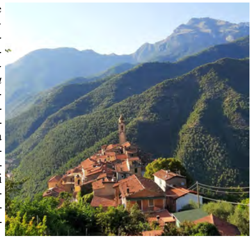
Castel Vittorio, da sud. In alto, lo splendido monte Toraggio m 1.972

senti le forme derivate Castelbianco , Castelnuovo (di Magra) , Castelvecchio (di Rocca Barbena) e Castiglione Chiavarese , mentre l'unico Castello senza aggettivi è un centro abitato minore nel comune di Carro (SP). A parte, si può considerare il ponentino Castel Vittorio , già Castel Dho , poi (dopo il 1280, quando di-