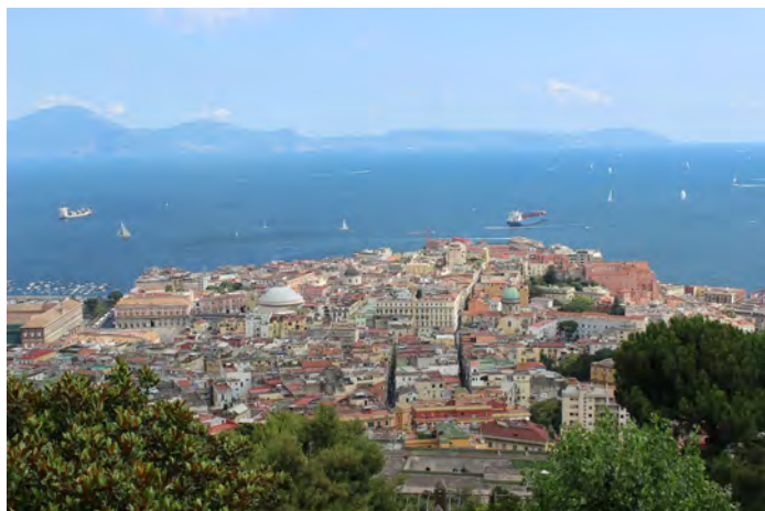
Napoli, dalla Certosa di San Martino veduta verso Pizzofalcone, l'area dove sorse la polis greca