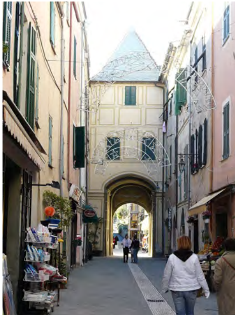
Una porta del Borghetto Santo Spirito, centro minuscolo demograficamente "esploso" dal 1960. (Foto Davide Papalini, Rapallo, 2008)

Il fenomeno dell'utilizzo di nomi comuni, peraltro, non è limitato alle "Neapolis" (meglio "neà poleis", nuove città), ma si incontra spesso, ogni volta che si evidenzia nel paesaggio un determinato elemento fisico o di origine antropica: tralasciando per oggi i primi, e occupandoci solo di quelli che sono in qualche modo legati ad interventi dell'uomo, possiamo trovare innanzi-