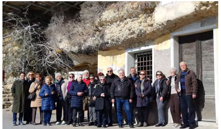
Il gruppo di soci che ha partecipato alla "passeggiata geografica" del 4 marzo ad Arma di Taggia

→ Da parte sua la Russia ha mantenuto rapporti abbastanza intensi con molti stati, evidentemente non solo i quattro che si sono opposti alla condanna, ma anche altri, ai quali negli anni scorsi ha fornito armi. In un recente articolo il giornalista Francesco Petronella 7 si domandava quanti e quali alleati siano oggi rimasti a Putin e concludeva che molti di coloro che si erano astenuti dal votare la famosa risoluzione del marzo 2022 hanno più o meno interesse a mantenere buoni rapporti con la Russia o, come nel caso dell'Algeria, a barcamenarsi volutamente in una posizione di ambiguità strategica tra Occidente, Cina e Russia.