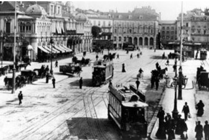
La piazza Massena, punto nodale della rete tranviaria nizzarda, dal 1897 gestita dalla Compagnie des Tramways de Nice et du Littoral, che eserciva pure le linee suburbane

Con lo sviluppo dell'automobilismo l'Amministrazione comunale preferì negli anni trenta del Novecento passare gradualmente