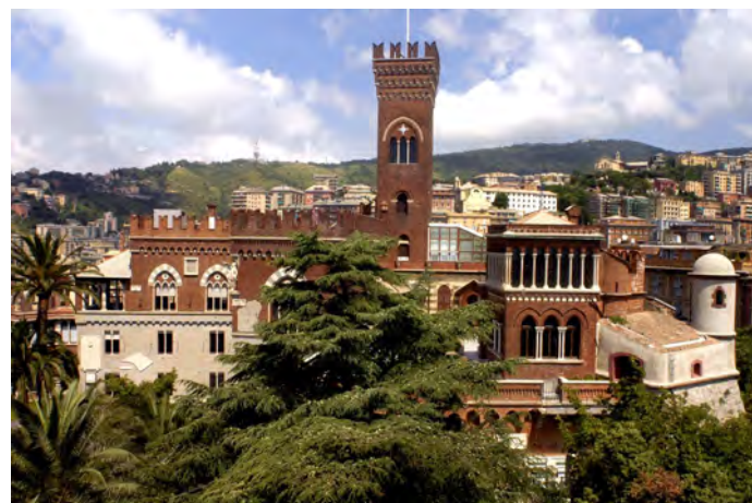
Genova, il Castello D'Albertis, in corso Dogali 18, sede del Museo delle Culture del Mondo.