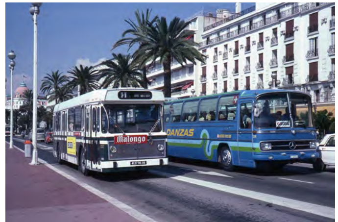
Un autobus urbano su corsia riservata sulla promenade des Anglais a fine anni 70

al trasporto su gomma, riducendo nel 1938 il servizio tranviario e abolendolo del tutto nel 1953. Si trattò di servizi sia di autobus sia di filobus, che inizialmente assolsero bene il loro compito, ma nel dopoguerra lo sviluppo tumultuoso dell'automobilismo privato intasò presto le strade principali e fece comprendere come non fosse quella la scelta giusta, anche perché non si prevedevano molte corsie riservate ai soli mezzi pubblici (in molte strade strette impossibili da tracciare) e la velocità commerciale