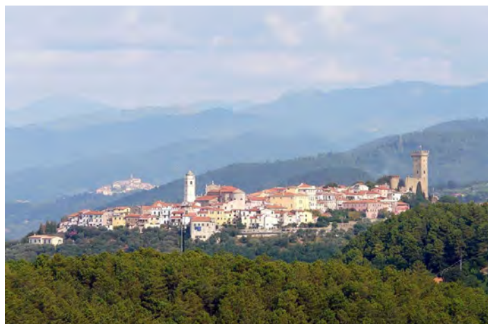
Un'immagine di Castelnuovo di Magra

Ben diversa è l'importanza del termine "castello", che nella forma latina castellum viene considerato un diminutivo di castrum : è presente sia nelle forma normale, sia in parecchi derivati, come "castiglione" (in origine con valore di diminutivo),