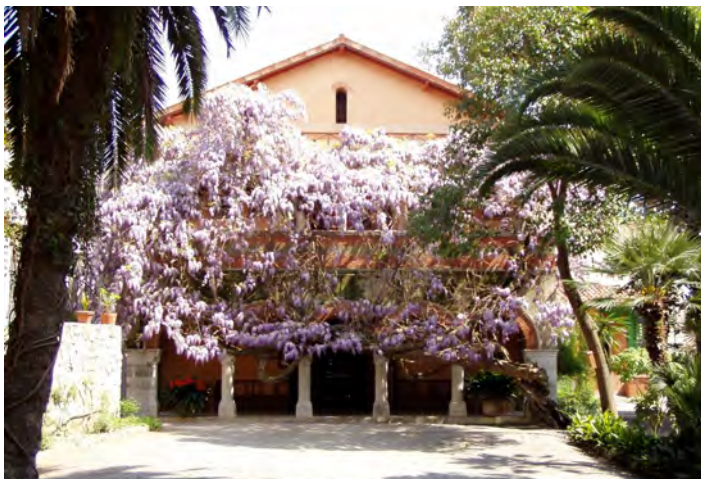
Bordighera, la facciata del Museo Clarence Bicknell, coperta dai rami fioriti di una pianta di glicine.

A parte l'evento che dovrebbe avvenire a Levanto nell'ambito della settima edizione del "Festival delle geografie", organizzato da Officine del Levante (e su cui invitiamo i lettori della zona ad informarsi direttamente), due saranno le manifestazioni organizzate da AIIG-Liguria, una a Bordighera, l'altra a Genova. Ad esse invitiamo i nostri soci, sia per l'interesse di ciascuna manifestazione sia come occasione di socializzazione tra geografi.