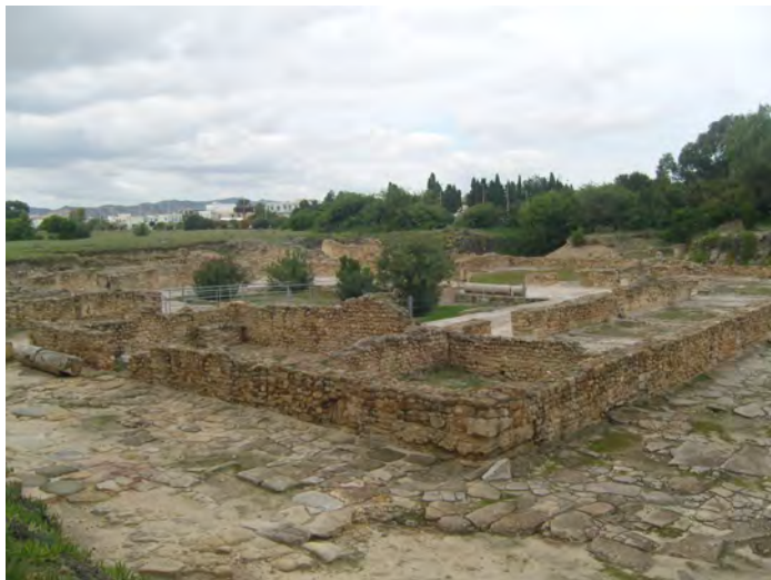
Nabeul, la casa delle Ninfe nel sito archeologico di Neapolis