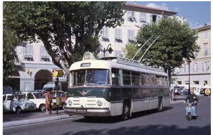
Dalla fine degli anni 30 i filobus (e gli autobus) si sostituirono ai tram, dalla linea per Cimiez (nel 1942) ad altri percorsi in centro. Qui, nel 1968, in piazza Garibaldi, un filobus della linea 9.