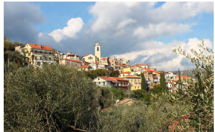
Torrazza (Imperia) (www.imperiadavedere.it)

Un altro nome che ha dato origine di frequente a toponimi è "torre", la cui presenza può essere isolata o facente parte di qualche altra opera difensiva, ma anche una 'torre campanaria' o una 'casa a forma di torre, adibita a colombaia'); la si ritrova un po' in tutta Italia, e in Liguria compare nella forma base ( Torre Paponi , in comune di Pietrabruna, IM) sia con forme peggiorative ( Torrazza , nei comuni di Sant'Olcese e di Imperia).