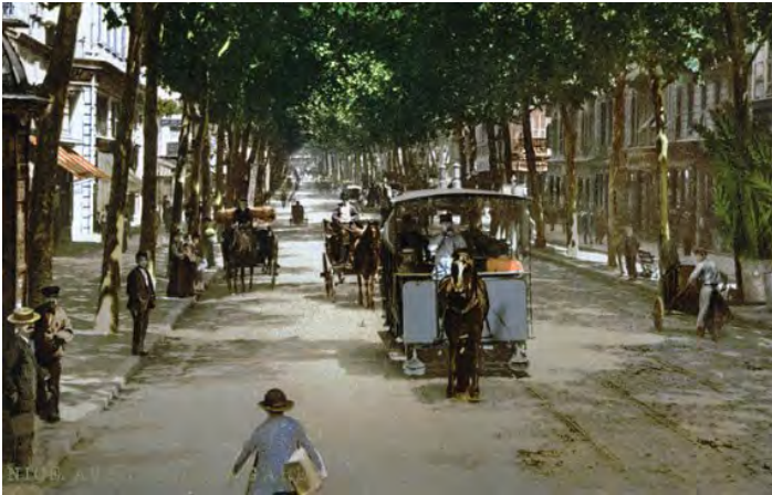
Tram a cavalli lungo l'Avenue de la Gare (oggi Av. Jean Médecin), prima del 1900 (foto, colorata, conservata a Washington, Congress Library)

La città, quando nel 1860 divenne francese, aveva circa 45.000 abitanti, ma dopo qualche decennio di crescita lenta ebbe un rapido aumento della popolazione, tanto da triplicarla in cinquant'anni (1911: 143.000 abitanti), crescendo ancora fino al 1936, quando si raggiunsero i 242.000 abitanti. Dopo il "crollo" durante la seconda guerra mondiale, si è ripartiti dal 1954 con 244.000 e, in un ventennio si sono toccati (1975) i 344.000 abitanti, valore rimasto stabile fino ad oggi (2020: 346.376) 1 .